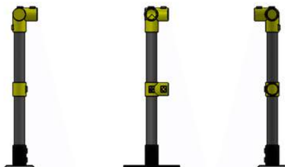
Imagen 1. Vistas

Material: Tubo de acero al carbón. Peso: 3.8 Kg. Aplicación: Se monta en el UABP y permite la protección y controla el riesgo de caída. Usuarios: N/A. Tipo de punto de anclaje: Fijo.