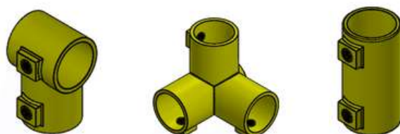
Imagen 3. Componentes